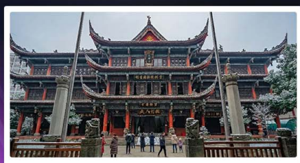
วัดเหวินซู