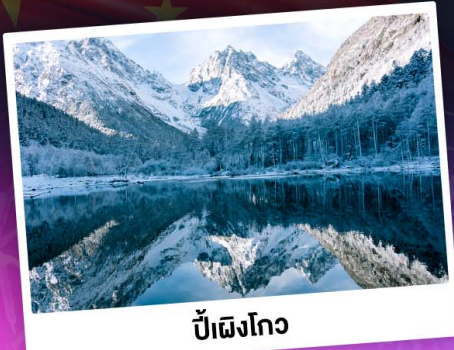
ป่าเผิงโกว

ท่องเขาแอลป์เมืองจีน "ภูเขาสี่ดรุณี" ชมความสวยงามของอุทยานป่าเผิงโกว