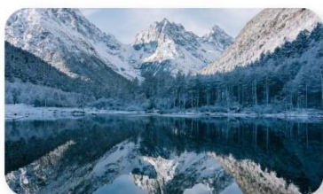
ปี้ฝิงโกว