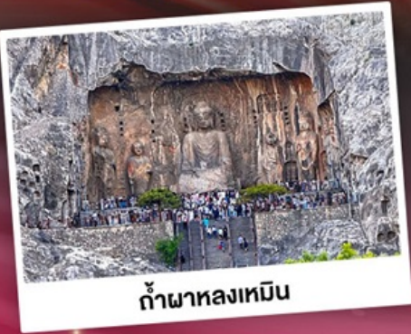
ถ้ำผาหลงเหมิน