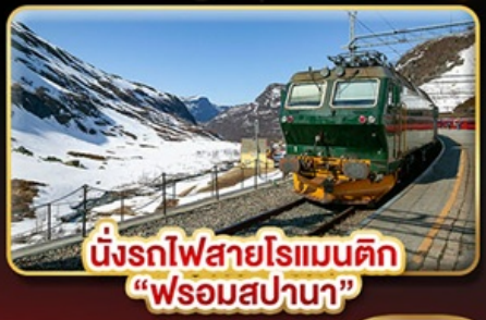
นั่งรถไฟสายโรแมนติก “พร้อมสปา”