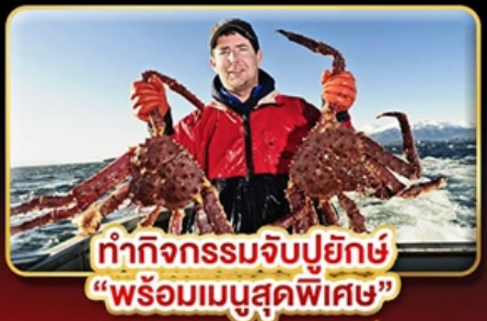
ทำกิจกรรมจับปูยักษ์ “พร้อมเมนูสุดพิเศษ”