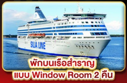
พักบนเรือสำราญ แบบ Window Room 2 คืน