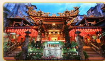
วัดเทียนฮั่ว จอพรเจ้าแม่หม่าจู