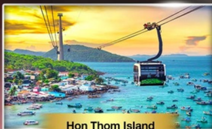
Hon Thom Island