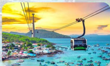
Hon Thom Island