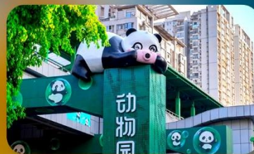
สกานีหมี่แพนด้า