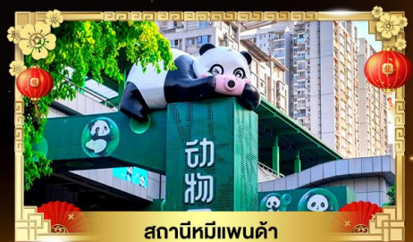
สถานีหมีแพนด้า