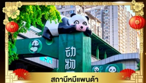
สถานีหมีแพนด้า