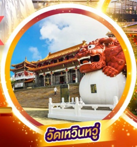
วัดหัวหนิว