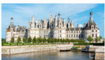
เข้าชมพระราชวังซ็องบอร์