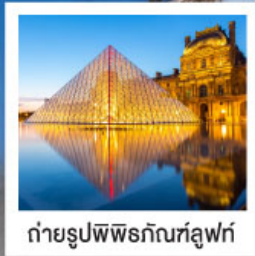
ถ่ายรูปพีพีร์กัทลูฟท์