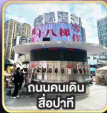
ถนนคนเดิน- สี่牌坊