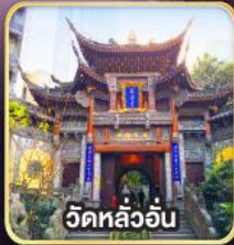
วัดหลัวอัน