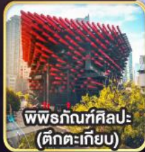
พิพิธภัณฑ์ศิลปะ- (ตึกตะเกียบ)