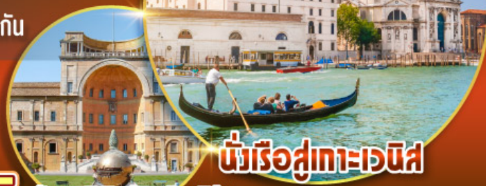
นั่งเรือสู่เกาะเวนิส