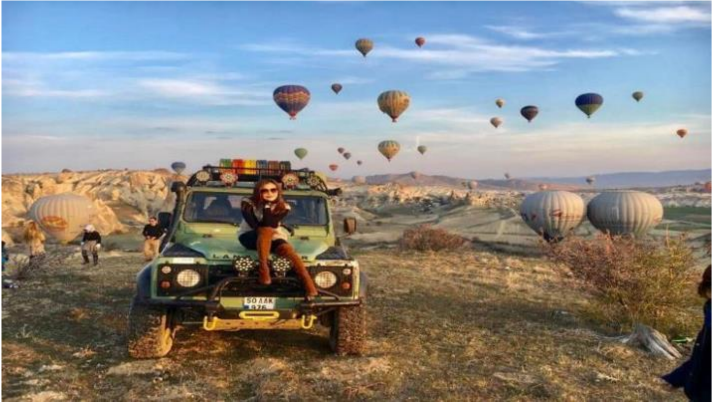
3. Classic Car นั่งรถคลาสสิก เปิดประทุน สูดอากาศ เย็น สดชื่น พร้อมชมบอลลูนสีสันสดใส วิวเมือง คัปปาโดเกีย ค่าใช้จ่าย 120 USD / ท่าน