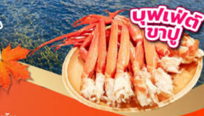
บุฟเฟ่ต์ 23 บาท

รวมจุดเช็คอินชมใบไม้เปลี่ยนสี โอซาก้า ชิซุโอะกะ ฟูจิ โตเกียว