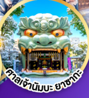
ศาลเจ้านิมมะ ยาชากะ