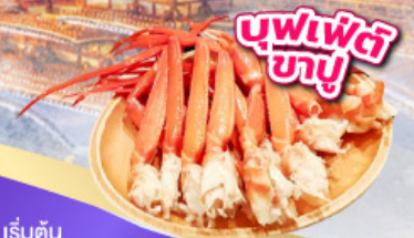
บุฟเฟ่ต์ ซาซึ