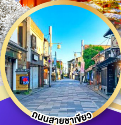
ถนนสายชาเขียว