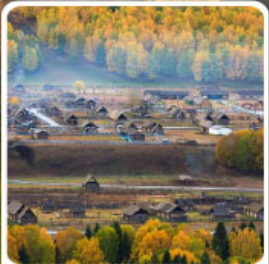
หมู่บ้านเหมู่

สวรรค์ใบไม้เปลี่ยนสี เยือนคานาสีอแคนฟัน มหัศจรรย์หมู่บ้านเหมู่ เคนเคอทัวไห่ อัจฉริยะภูผาหิน