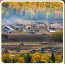
หมู่บ้านเหม่มู

สวรรค์ใบไม้เปลี่ยนสี เขื่อนคานาสีอแดนฟัน มหัศจรรย์หมู่บ้านเหม่มู เคอเคอทัวไห่อัศจรรย์ภูผาหิน