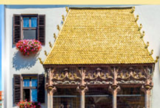
หลังคาทองคำอินน์สบูร์ค