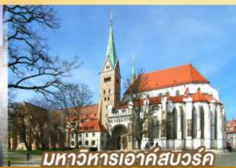
มหาวิหารเอาก์สเวิร์ค