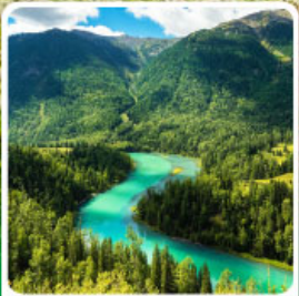
ทะเลสาบคานาสือ