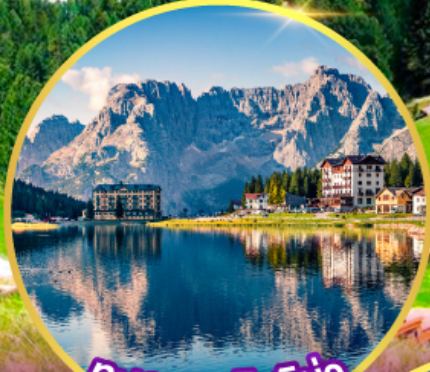
ทะเลสาบมิสุร์น่า