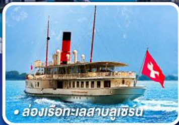
• ล่องเรือทะเลสาบลูซิร์น