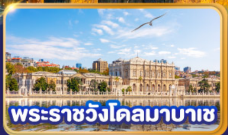
พระราชวังโดลมาบาซ