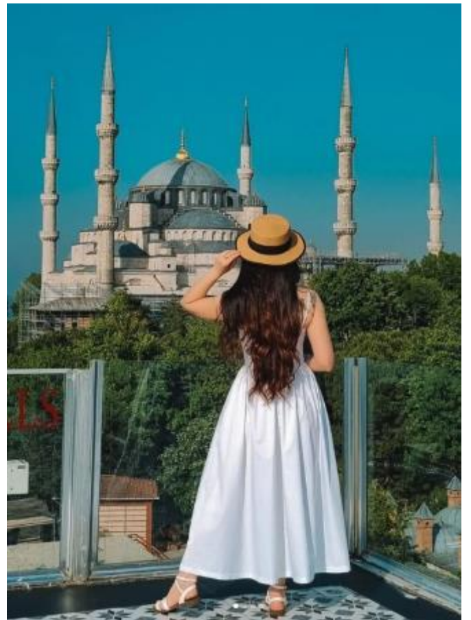
สมควรแก่เวลา นำท่านเดินทางสู่สนามบินอิสตันบูล