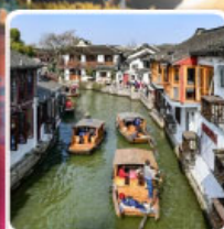
หมู่บ้านโบราณจูเจียวเจียว