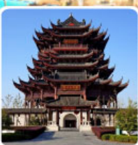
วัดหลงหยวน