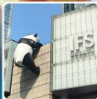
แพนด้ายักษ์ปิ่นตักIFS