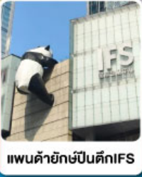
แพนด้ายักษ์ปีนตึกIFS