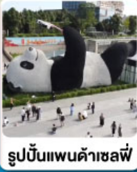
รูปปั้นแพนด้าเซลฟี