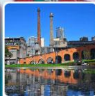
Eastern Suburb Memory Chengdu