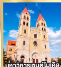
มหาวิหารเซนต์ไมเคิล