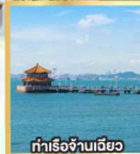
ท่าเรือจั้นเฉียว