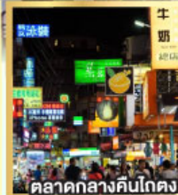
ตลาดกลางคืนโตกง