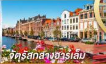
จัตุรัสกลางฮาร์เล็ม