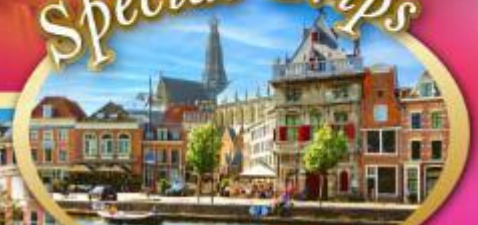
เก็บครบเบเนลักซ์ แะที่ฮาร์เล็ม