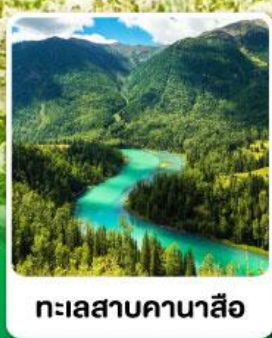
ทะเลสาบคานาสีอ