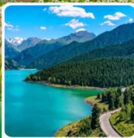
อุทยานเทียนซาน เทียนฮือ