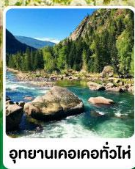
อุทยานเคอเคอทัวไห่