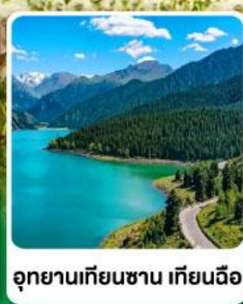
อุทยานเทียนชาน เทียนฉือ