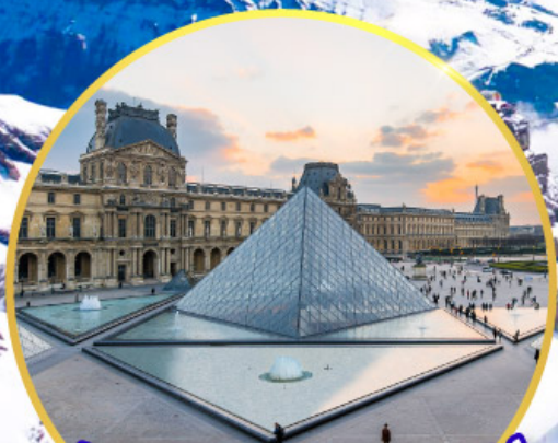
ถ่ายรูปคู่พีพีร์กันที่ลูฟร์