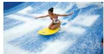
TAME THE TIDES