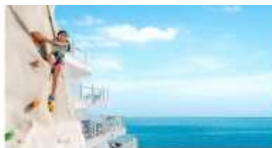
ROCK THE WALL