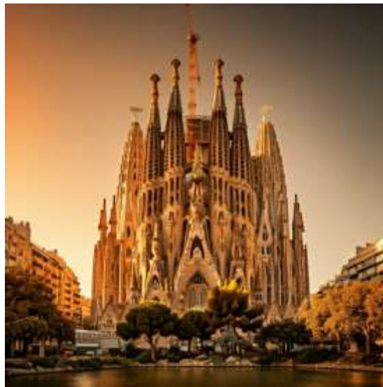
Sagrada Família barcerona spain

มหาวิหารซากราดาแฟมิลีย (Sagrada Família): สัญลักษณ์ของบาร์เซโลนาและผลงานชิ้นเอกของเกาดิที่ยังสร้างไม่เสร็จ แต่ก็สวยงามตระการตาด้วยสถาปัตยกรรมที่แปลกตาและรายละเอียดที่ประณีต