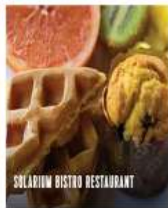
SOLARIUM BISTRO RESTAURANT