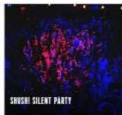
SHUSHI SILENT PARTY