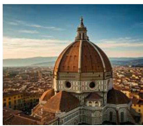
Duomo di Firenze

07.00 น . เรือสำราญกับถึง ท่าเรือ ฟลอเรนซ์/ปิซา(ลาสเปเซีย)อิตาลี รับประทานอาหาร เข้า กลางวัน เย็น ตามห้องอาหารที่เรือจัดไว้ให้ตามอัธยาศัย ฟลอเรนซ์: มหานครแห่งศิลปะ Duomo di Firenze: มหาวิหารฟลอเรนซ์ สถาปัตยกรรมโกธิคที่งดงามตระการตา Galleria degli Uffizi: พิพิธภัณฑ์ที่มีผลงานศิลปะของบรรดาจิตรกรชื่อดังมากมาย เช่น เลโอนาร์โด ดา วินชี และมิเคลองเจโล Ponte Vecchio: สะพานเก่าแก่ที่ข้ามแม่น้ำอาร์โน มีร้านค้าขายทองและเครื่องประดับเรียงราย Palazzo Pitti: พระราชวังที่เคยเป็นที่ประทับของตระกูลเมดิชิ Piazza della Signoria: จตุรัสกลางเมืองที่รายล้อมไปด้วยอาคารสำคัญต่างๆ