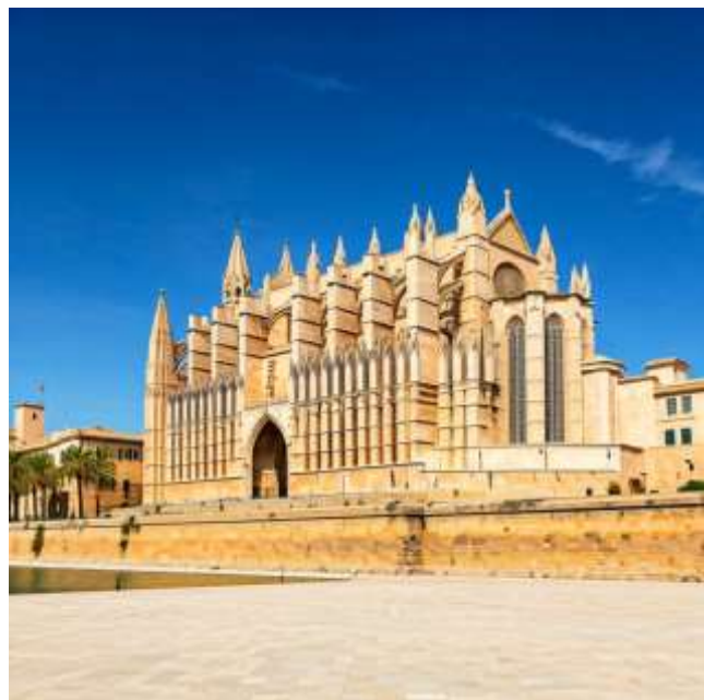
Palma de Mallorca:

Catedral de Mallorca: มหาวิหารปาล์มา เด มายอร์กา สถาปัตยกรรมโกธิคที่สวยงามตระการตา ภายในมีกระจกสีสวยงามและโคมไฟระย้าขนาดใหญ่