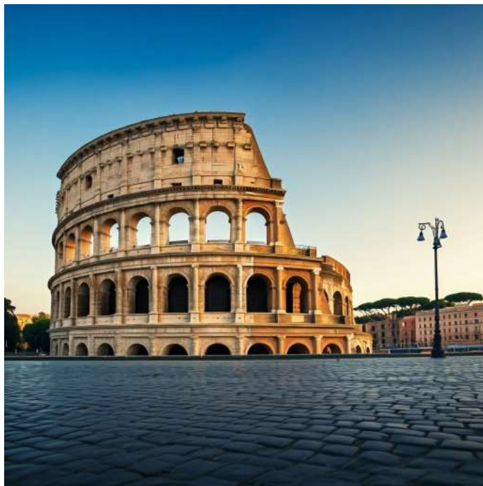
โคลอสเซียม กรุงโรม เริ่มสร้างขึ้นในสมัย จักรพรรดิเวสเปเซียน แห่ง จักรวรรดิโรมัน

ซีวีตาเวกเกีย (Civitavecchia) เมืองท่าสำคัญของอิตาลี ตั้งอยู่บนชายฝั่งทะเลดิเรเนียน ใกล้กรุงโรม ด้วยความเป็นเมืองท่าที่คึกคัก ทำให้ซีวีตาเวกเกียมีเสน่ห์ที่ผสมผสานระหว่างความเก่าแก่ของอาคารสถาปัตยกรรม และความทันสมัยของท่าเรือ