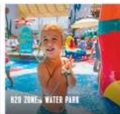
B20-ZONE WATER PARK