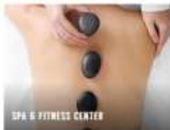
SPA & FITNESS CENTER