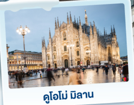
คูโอโม มิลาน