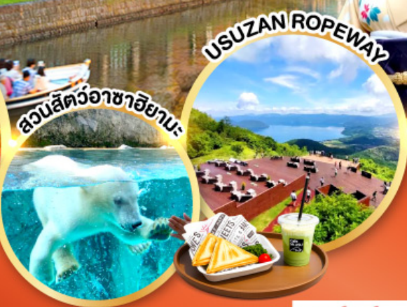
สวนสัตว์อาซาฮิยามะ