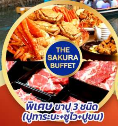
พิเศษซาปู 3 ชนิด (ปูทะเล+ปูม้า+ปูซิม)