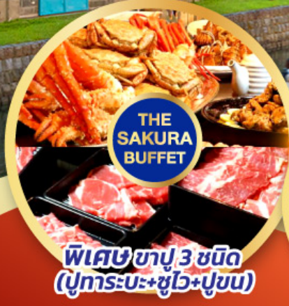
พิเศษซาปู 3 ชนิด (ปูทะเล+ปูวุ้น+ปูขน)