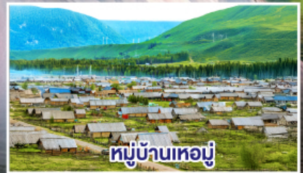
หมู่บ้านทอผ้า