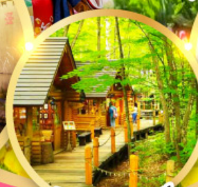
นิงเกิ้ลทอเรีย