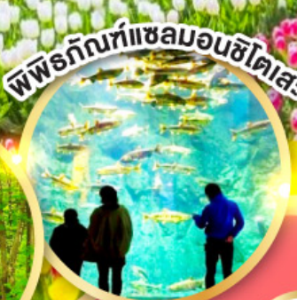
พิพิธภัณฑ์แซลมอนชิโตเสะ