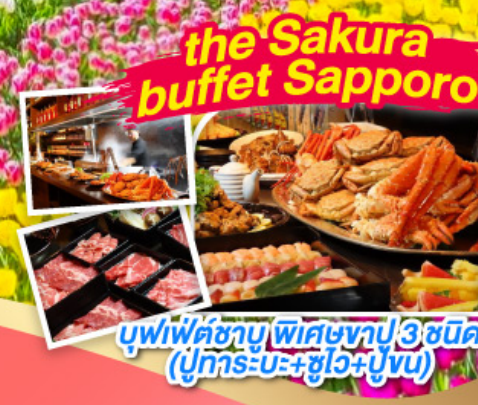
the Sakura buffet Sapporo