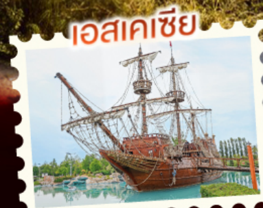
ไอเอสเคเซีย