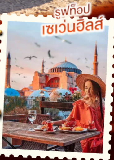
รู่ทึอปล เซอ่วนฮึลส์

วันเดินทาง 20 - 27 พ.ค. 69 | 1 - 8 มิ.ย. 69