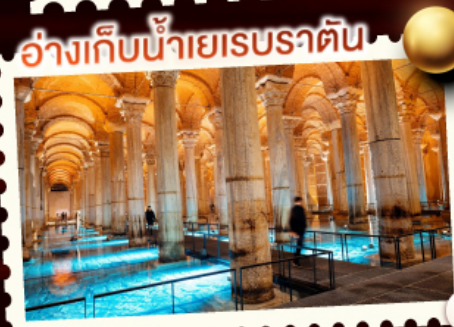
อังกึบน้ำยอบราตึบ