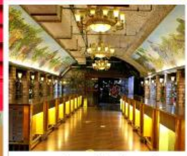
พิลเบียร์ที่ไวน์ชิงเต่า