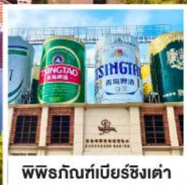
พิลเบียร์ที่เบียร์ชิงเต่า