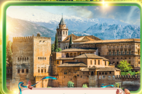
พระราชวังอาลัมบรา