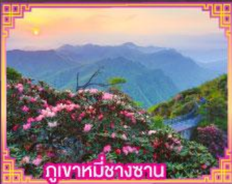
ภูเขาหมีขาชาน