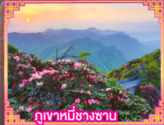
ภูเขาหิมะชางซาน