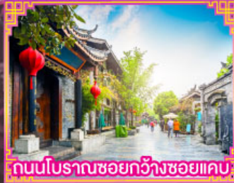
ถนนโบราณชอยกวงฮวยแคบ