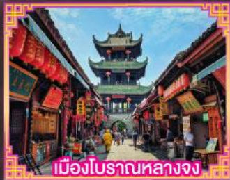
เมืองโบราณหลางจง