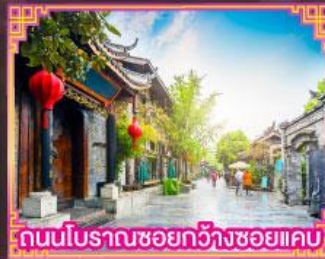
ถนนโบราณชอยกวางชวยเคบ