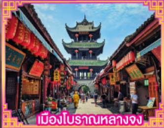
เมืองโบราณหลางจง