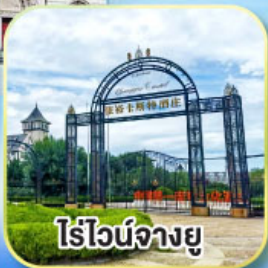
ไร่ไวน์จางยู