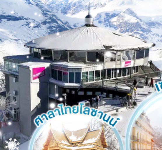
ศาลาไทยโลซานน์