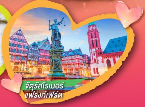
จัตุรัสโรเมอร์ แฟรงก์เฟิร์ต