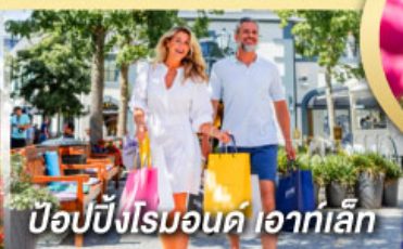
ป๊อปบิงโรมอนด์ ไอเกิ้ล