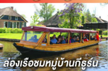
ล่องเรือชมหมู่บ้านกังหัน

สุดพิเศษ กับสวนดอกทิวลิป ที่จัดเพียงปีละหนึ่งครั้ง