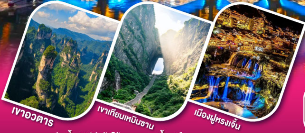
เจาอวตาร