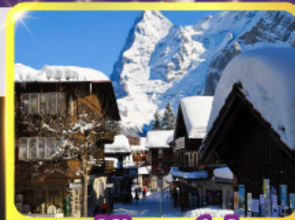
หมู่บ้านมูร์เรน