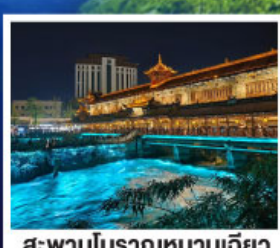
สะพานโบราณหนานเฉียว