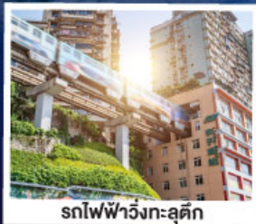
รถไฟฟ้าวิ่งทะลุคิก