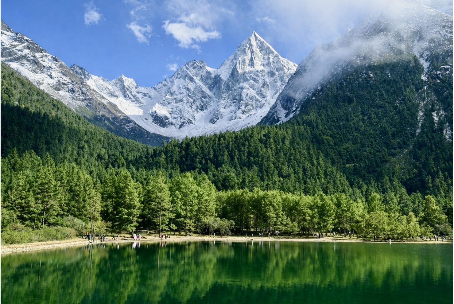
GO1TFU-SL020 เฉิงตู ฉงชิ่ง มรดกโลกพระหินแกะสลักตำจู้ อุทยานหลุมบ่อฟ้า อุทยานเขานางฟ้า อุทยานภูเขาสี่ตระกูล อุทยานปีเฝิงโกว (นั่งรถไฟความเร็วสูง) *ไม่ลงร้านช้อปปิ้ง* 7วัน 6คืน โดยสายการบิน Thai Lion Air (SL)