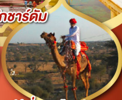
ฟรี ขี่อูฐ เมืองมันทวา ราคาเริ่มต้น