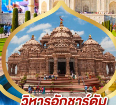
วิหารอักซาร์ดัม