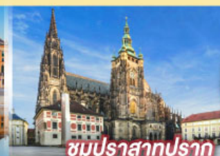
ชมปราสาทปราก