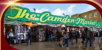
ตลาดแคมเดน