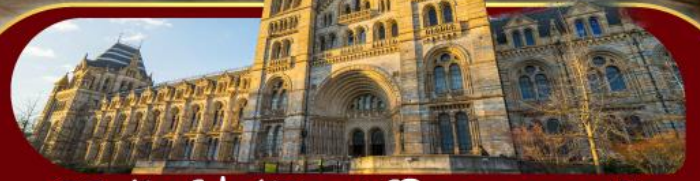
พิพิธภัณฑ์ประวัติศาสตร์โลกทางธรรมชาติ