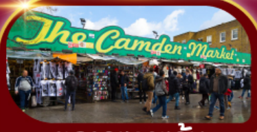
ตลาดแคมเดน