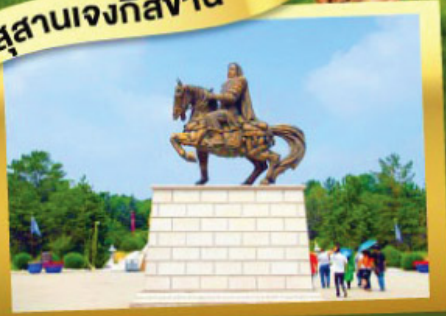
เนินทรายสีงาชวาน