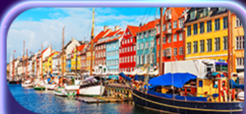
ย่านฮูสวานน์