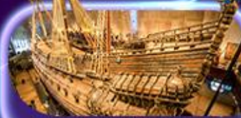
พิพิธภัณฑ์ทว่าซา