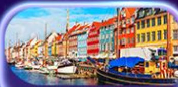
ย่านนูฮาวน์

ย่านดิงย่านนูฮาวน์ ซ็อบบิงเฮสปลานาติ ถนนคนเดิน Stroget