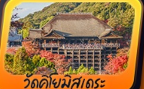
วัดคิโยมิสุเดระ