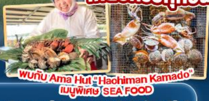
พบกับ Ama Hut "Haohiman Kamado" เมนูพิเศษ SEA FOOD