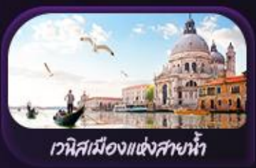
เวนิสเมืองแห่งสายน้ำ

พลอเรนซสติก, พิชชามากาเร็ตา, สเปาเก็ตตีหมึกดำ, หอยเอสคาโท